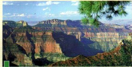
Estratos de origem sedimentar.

JOAQUIM BOTELHO DA COSTA in "Estudo e Classificação de Rochas Sedimentares por Exame Macroscópico" (Adaptado)